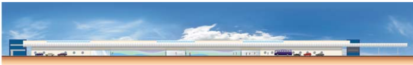
ELEVAÇÃO LADO TERRESTRE