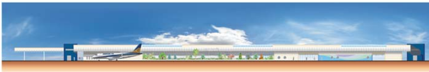
ELEVAÇÃO LADO AÉREO