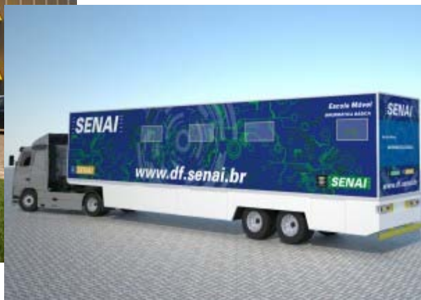
Unidades Móveis - Estratégias Flexíveis