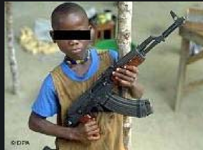
Cena do filme