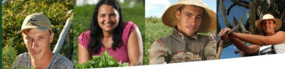
ATER - VALOR EXECUTADO 2003/2011 E PROGRAMADO 2012