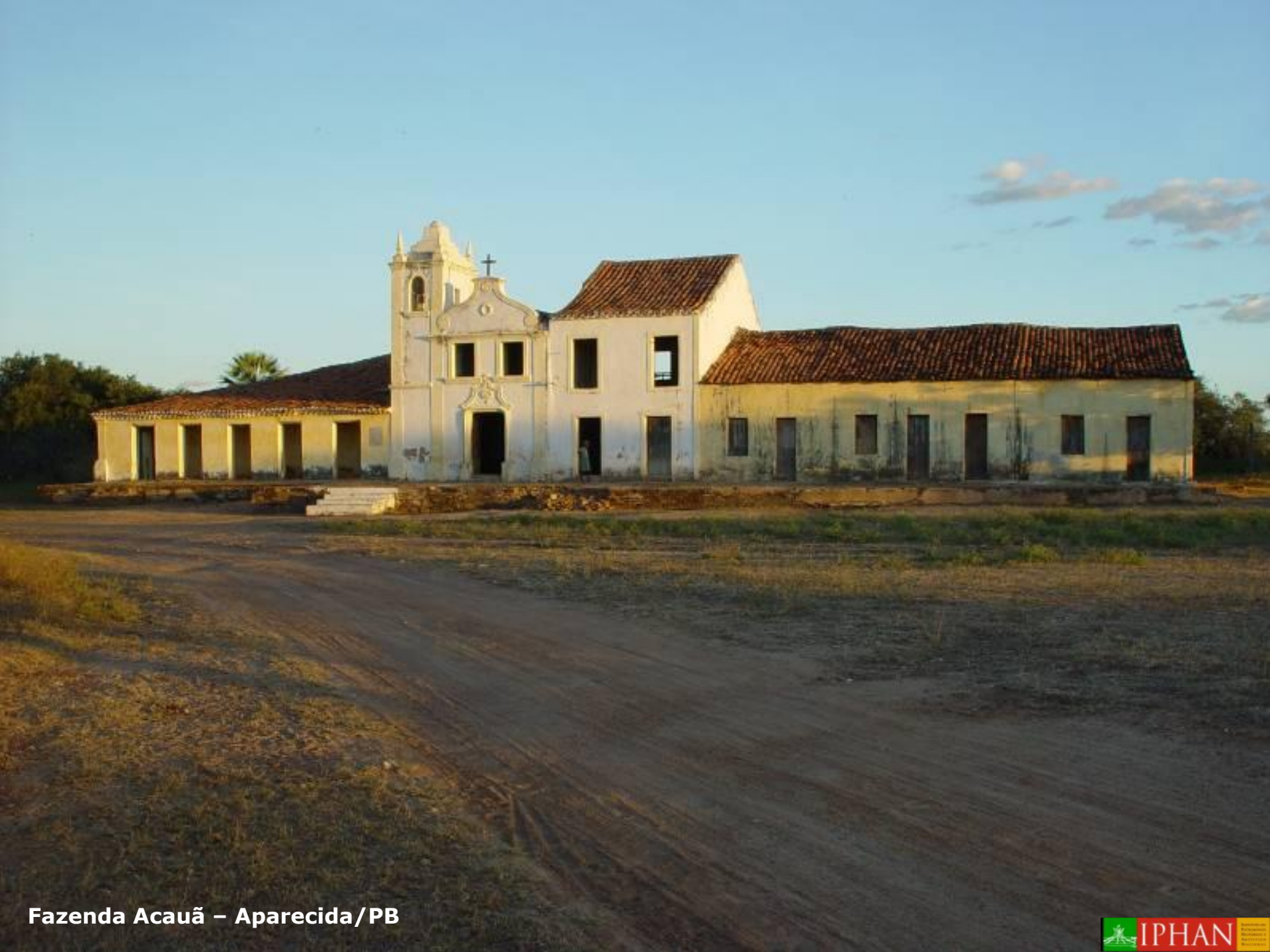
Fazenda Acauã – Aparecida/PB