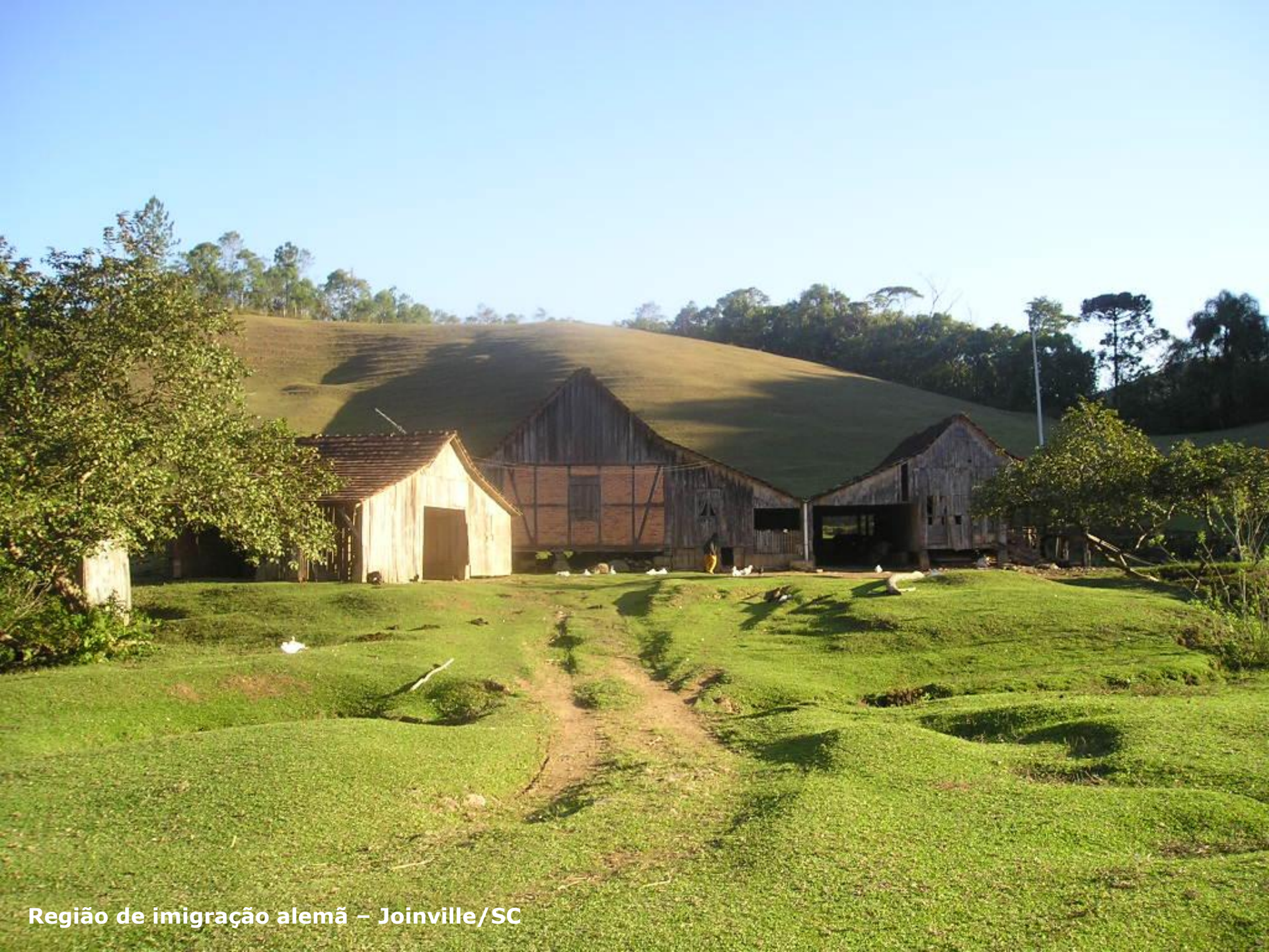
Região de imigração alemã – Joinville/SC