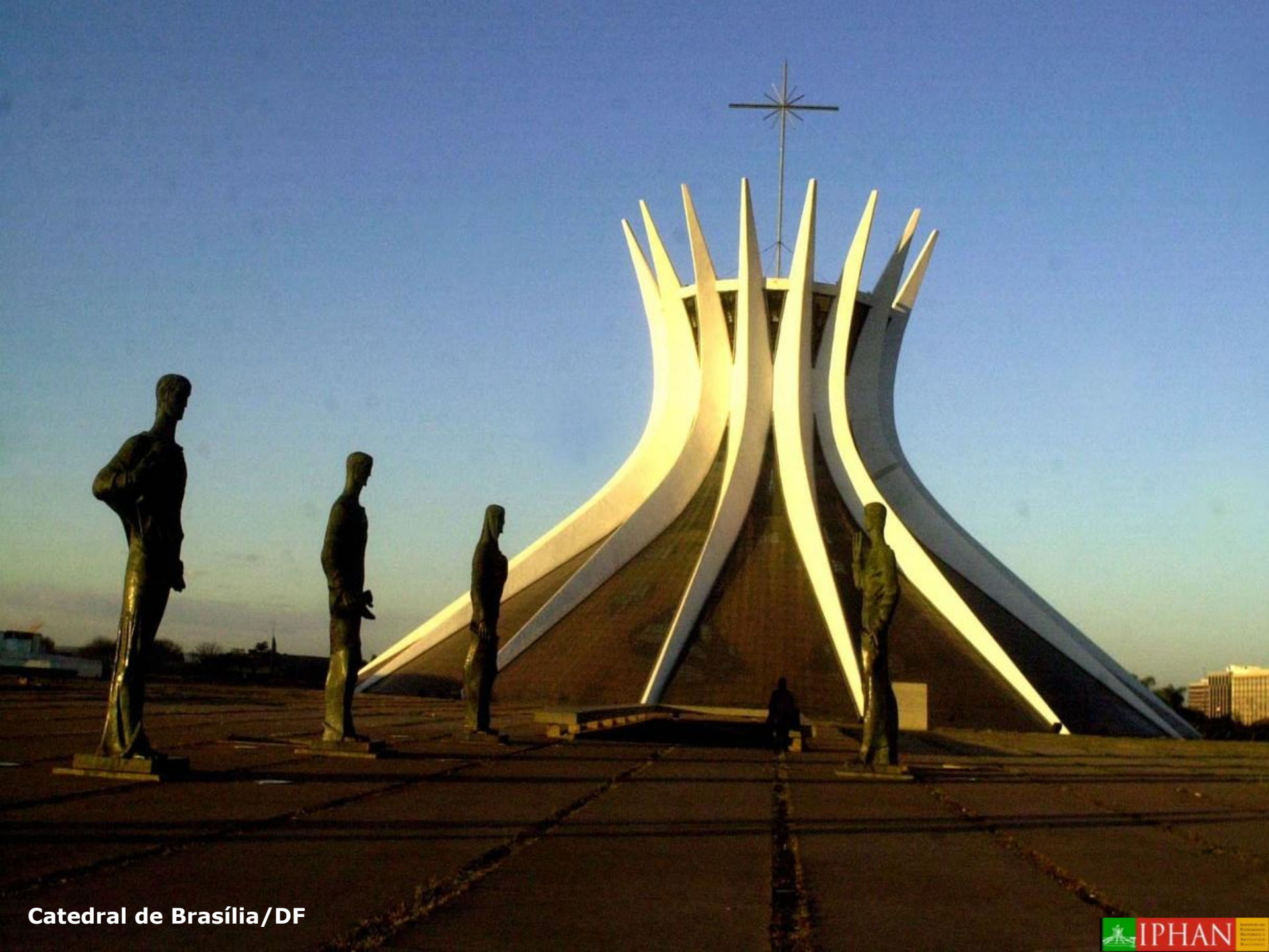
Catedral de Brasília/DF