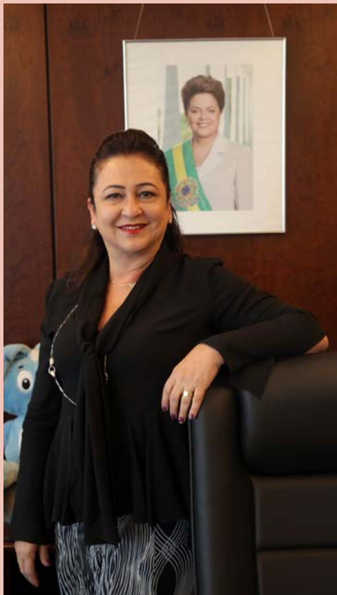
Antônio Araújo / Mapa

T odos os dias testemunhamos a culpabilização da mulher em crimes cometidos contra ela mesma. O julgamento costuma passar por questões morais de conduta pessoal: a roupa que vestem, os lugares que frequentam, as escolhas sexuais que fazem.