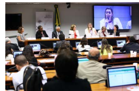
Público lotou auditório na Câmara

O programa Pautas Femininas com o resumo deste encontro será veiculado pela Rádio Senado no dia 8 de julho (sexta-feira), às 6h45min, com reprises na quinta-feira seguinte, às 21h, e na segunda-feira subsequente, às 6h.