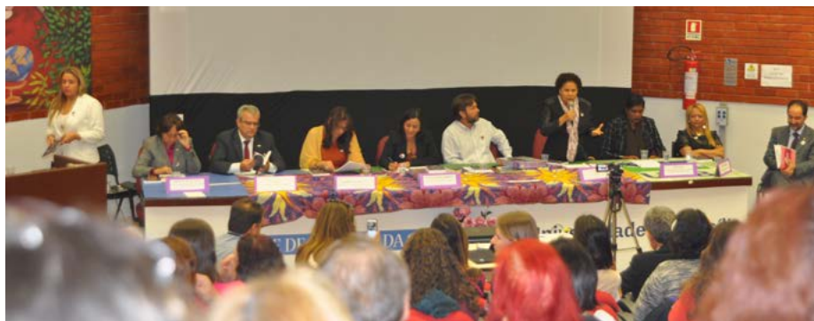
Senadora Regina Sousa fala em seminário na UnB sobre feminicídio

Ela citou como exemplo a criação da Comissão Externa da Câmara dos Deputados destinada a acompanhar a apuração e ações vinculadas aos crimes de estupro em todo o território nacional. “O feminicídio é uma situação-limite. A pena deve ser aplicada, mas não devolve a vida da mulher. Já os casos dos estupros no Rio de Janeiro e no Piauí, entre outras agressões, são exemplos de situações igualmente inaceitáveis e devem ser repudiadas por toda a sociedade, de forma educativa, porque a denúncia é a melhor arma para poupar a vida das mulheres”, alertou.